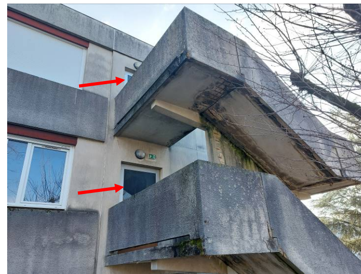
Escalier de secours