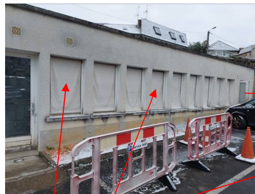
Bouchements total de baies