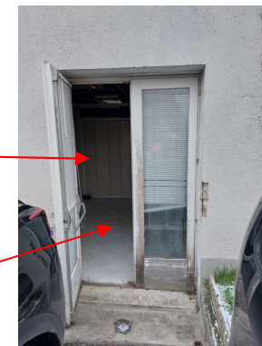
ancien accès EP0100005