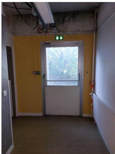
Portes à remplacer